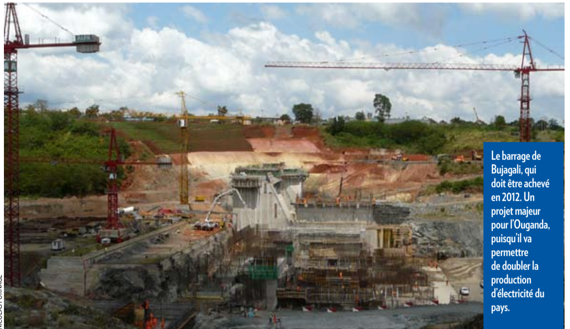
Le barrage de Bujagali, qui doit être achevé en 2012. Un projet majeur pour l'Ouganda, puisqu'il va permettre de doubler la production d'électricité du pays.

Avec une croissance moyenne de près de 8 % par an depuis le début de la décennie, l'Ouganda peine à satisfaire la demande d'électricité. Avec 50 kilowatt/heure par an et par habitant, le pays consomme quatre fois moins d'électricité que le Kenya voisin et 160 fois moins que la moyenne des pays de l'OCDE. Un problème qui n'est pas propre à ce petit pays d'Afrique de l'Est. Le FMI rappelait récemment qu'avec 63 gigawatts (GW), la