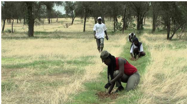
Campagne d'installation des plants.

notamment de réfléchir sur l'intérêt et le rôle des espèces végétales à valeur ajoutée, adaptées à la sécheresse le long de la Grande Muraille Verte et dans toute la zone sahélienne, en insistant spécifiquement sur trois pôles essentiels : l'alimentaire, le médicinal et le cosmétique », indique Aliou Guisse, également impliqué dans l'OHM-GMV dont il est le directeur adjoint. Certes, les espèces utilisées pour l'édification de la GMV ont été choisies pour leur adaptabilité aux conditions difficiles de la zone sahélienne. Mais les chercheurs souhaitent également s'intéresser aux plantes, déjà présentes de manière endémique dans ces régions, et que les populations utilisent depuis toujours dans leur alimentation, pour se soigner mais aussi dans la fabrication de leurs produits cosmétiques.