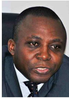
J.-B. Bokoto © CADE

sent pas que dans les nouvelles technologies mais couvrent tous les secteurs porteurs qui garantissent un retour sur investissement. Les motivations sont mercantiles ; les investisseurs ne sont pas des philanthropes. Ils sont cependant