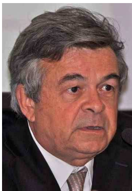
Michel Jacquier © CADE

Comment positionner ces activités pour qu'elles soient rentables à un niveau compatible avec l'objectif visé et dans le cadre d'un développement durable, en évitant le saupoudrage de financements sans lendemain ? Elles